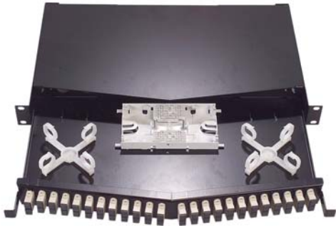
Панели AMP Hi-D SC-Duplex 1-1671167-X