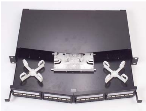
Панель AMP Hi-D LC-Duplex 1-1671166-1

Модульная ВО панель AMP Hi-D 1-1671260-1 Quick-Fit 6xSC Duplex (4 шт.) 0-1671201-X Комплект для ввода и организации линейного кабеля 0-1671273-1 или 0-1671274-1