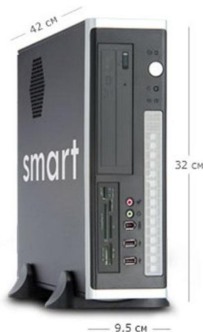
Smart E - series