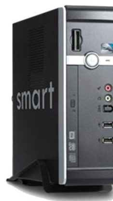
Smart M - series