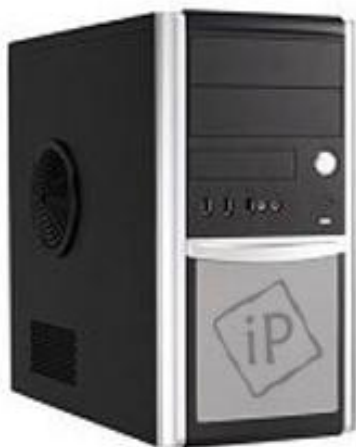
Smart L - series